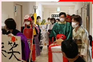
みなさんに福が来ます様に!