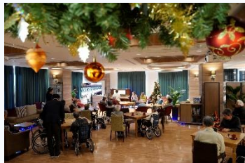
クリスマスツリーの点灯式