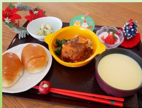
メニューは、ロールパン、ミートローフ、ミモザサラダ風、いちごババロア、コーンスープでした