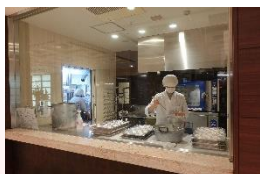
介護も厨房も暗い時間から 元旦スタートします