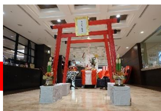
カメリア神社です