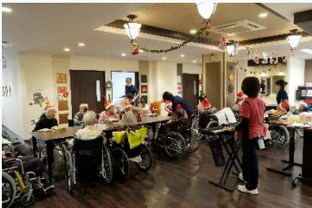
音楽療法士の伴奏でクリスマスソングを唄ったり、ケーキをいただき楽しみました

クリスマスのイベントは各階や協力ユニットで企画され、その様子はブログにも紹介していますので是非ご覧ください