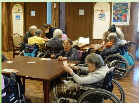
ユニットでは職員が準備した、干支の飾りをみんなで作りました