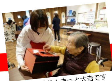
おみくじ! きっと大吉です