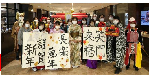
七福神がお揃いです (衣装は手作りです)