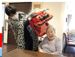
獅子舞とパシャリ