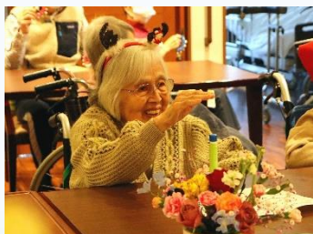
ハンドベルでご利用者と職員と一緒に演奏し楽しみました