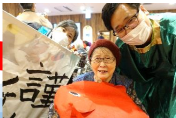
めで鯛と一緒にパシャリ!