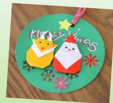
クリスマスカードも添えて