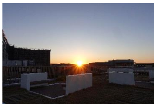
6:58 屋上庭園 初日の出です